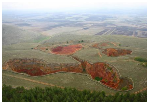
Cave di Bauxite